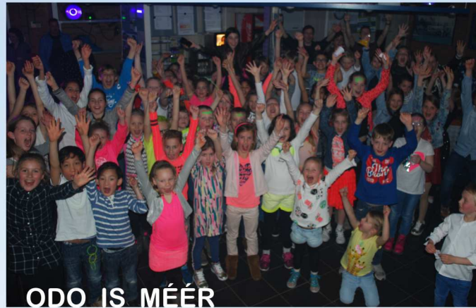
ODO IS MEÉR