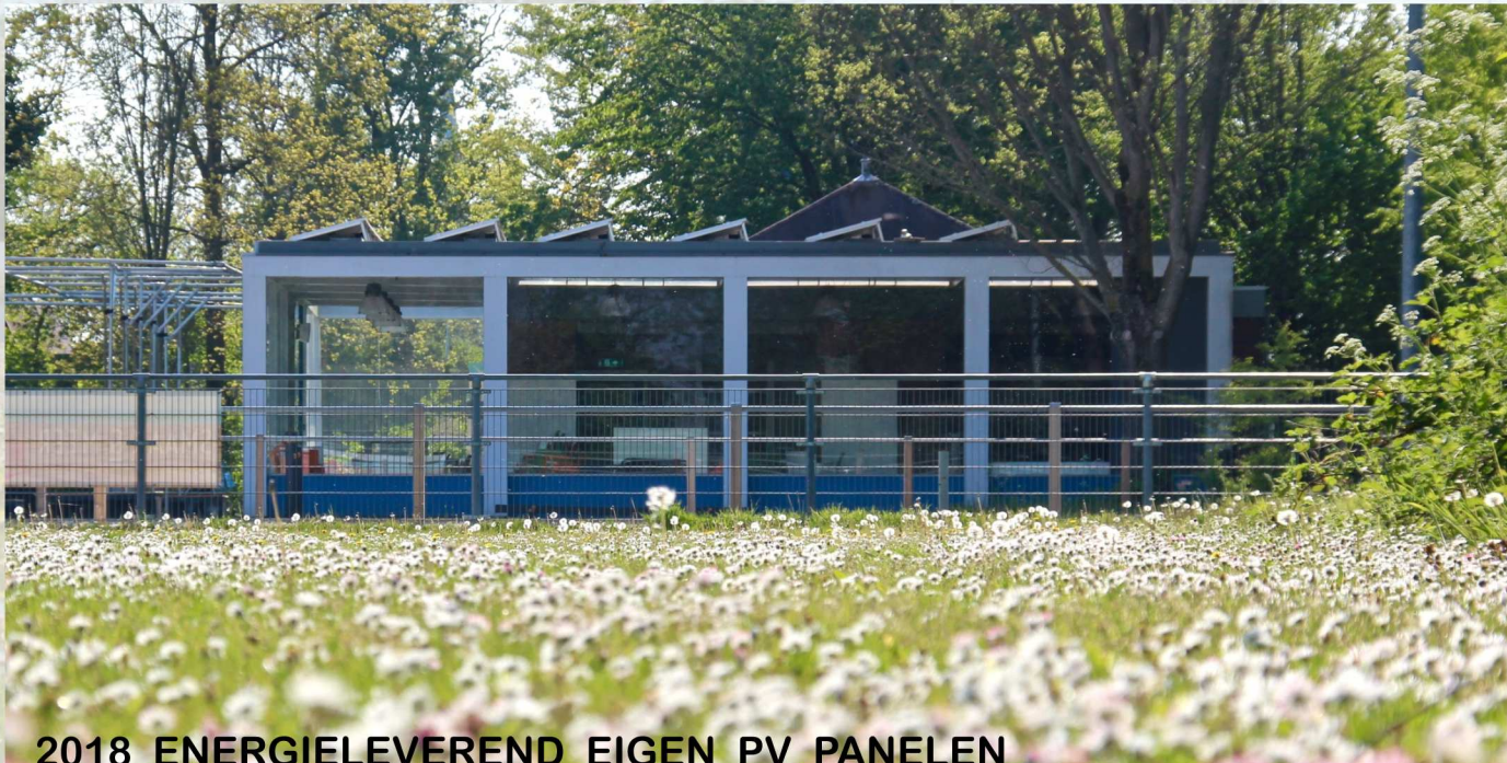
2018 ENERGIELEVEREND EIGEN PV PANELEN

ODO heeft niet alleen goede plannen op het punt van duurzaamheid en gezondheid maar heeft ook al veel gerealiseerd zoals: