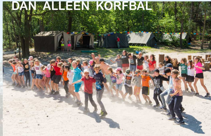
DAN ALLEEN KORFBAL

Een belangrijke partij in ons netwerk, met een bijzonder waardevolle rol, is onze sponsor BvB Substrates, producent van alle natuurlijke producten waar planten op groeien, zoals potgrond, cocos, tuinaarde en boomschors. BvB is een bedrijf met een sterke focus op duurzaamheid, kwaliteit, milieu en gezondheid.