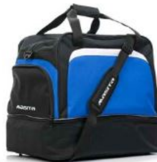
2 SR/JR met schoenenvak

De plaats van het aanbrengen van de naam is ook afgesproken met Biesheuvel sport : op het zijvakje van de tas. Het is dus niet mogelijk een lange naam op de tas aan te brengen.