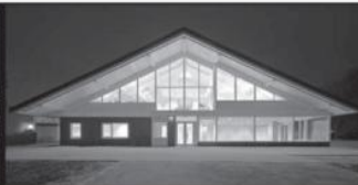
CBS Basisschool Maasland