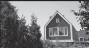
Erfwoningen Den Hoorn