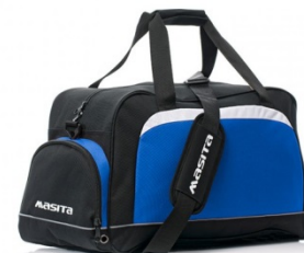
3 S zonder schoenenvak

Daarnaast is het nog steeds mogelijk om de maand September rokjes, broekjes en witte sokken/kousen of compressiekousen te kopen bij Biesheuvel sport tegen een korting van 20%!